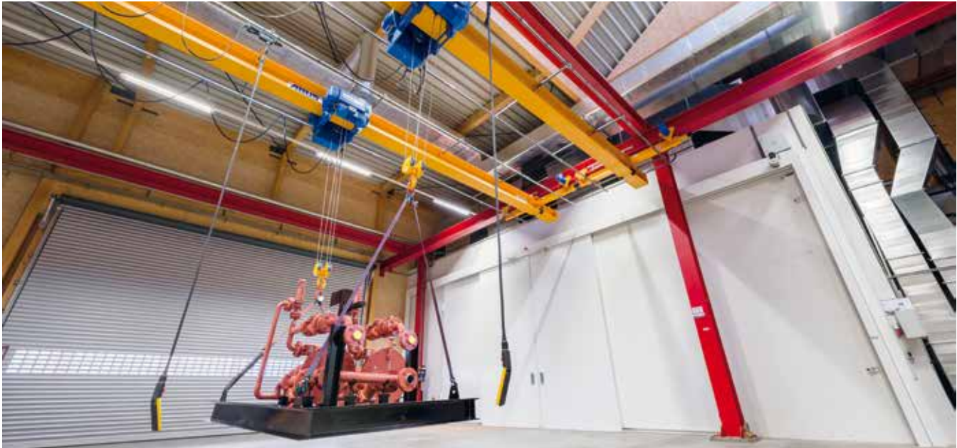
Krane zum Handling der Module sind ausreichend vorhanden.

Kompetenz, Platz und Einrichtungen für den Modulbau.