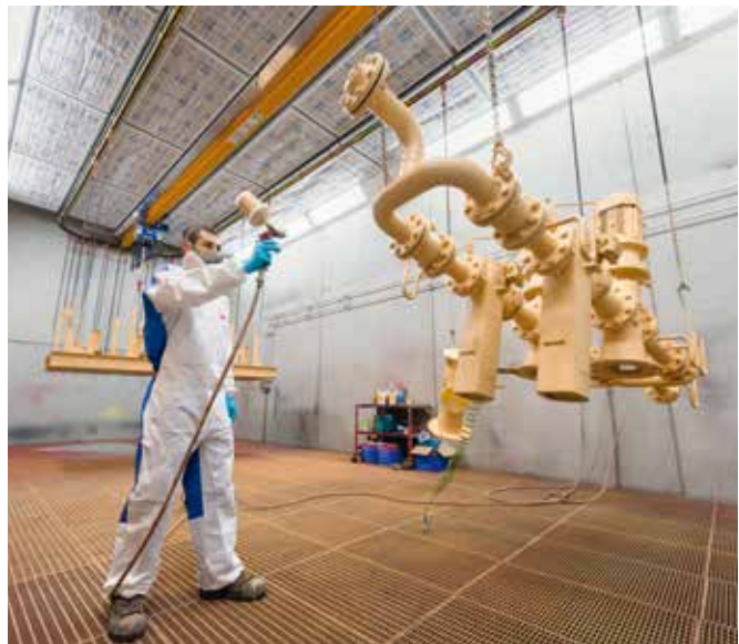
Eine von zwei Lackierereien.