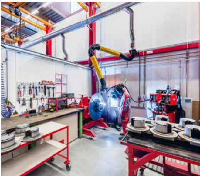
Eine von fünf modernen Schweißkabinen.